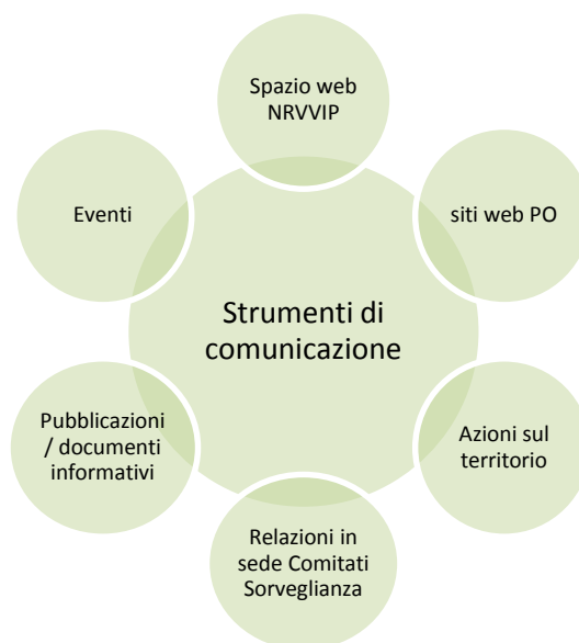
Figura 2. Gli strumenti della comunicazione proposti nel DUV

Pertanto nell'ambito della comunicazione una quota parte di attività sarà indirizzata al trasferimento di metodologie e pratiche funzionali a sviluppare un patrimonio comune di conoscenze presso gli attori ed i territori coinvolti nei processi implementativi del PSR. Tale azione potrà essere condotta attraverso: