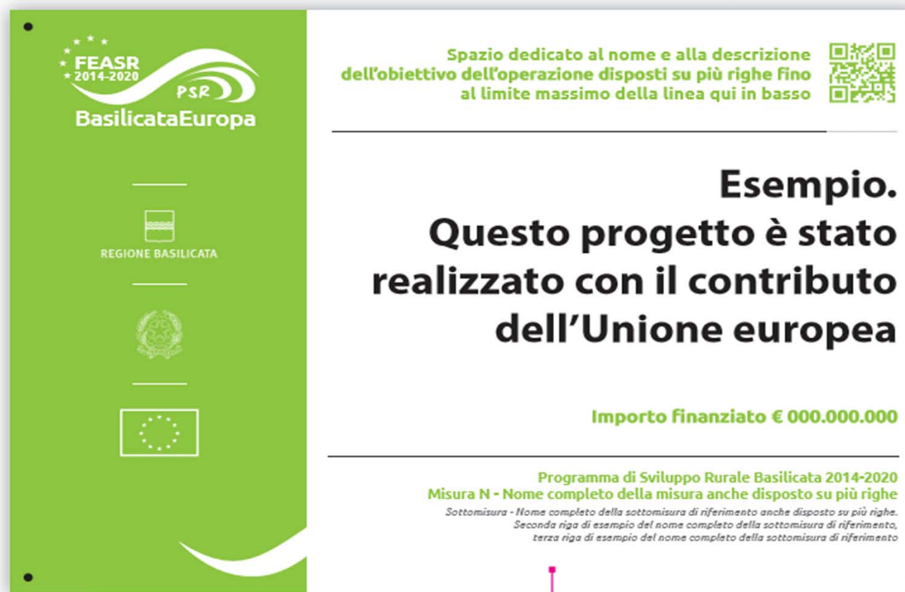
Targa 70x50 cm

http://europa.basilicata.it/feasr/wp-content/uploads/2016/09/FEASR1420_Manuale_LineaGrafica_WEB.pdf