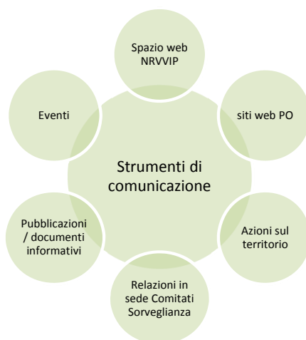
Figura 2. Gli strumenti della comunicazione proposti nel DUV

Pertanto nell'ambito della comunicazione una quota parte di attività sarà indirizzata al trasferimento di metodologie e pratiche funzionali a sviluppare un patrimonio comune di conoscenze presso gli attori ed i territori coinvolti nei processi implementativi del PSR. Tale azione potrà essere condotta attraverso: