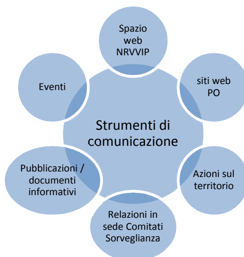
Figura 2. Gli strumenti della comunicazione proposti nel DUV.

La comunicazione delle azioni valutative si presta anche allo svolgimento di una funzione di accrescimento di competenze sui temi sia della cultura valutativa che dell'azione progettuale ad essa sottesa. Pertanto nell'ambito della comunicazione una quota parte di attività sarà indirizzata al trasferimento di metodologie e pratiche funzionali a sviluppare un patrimonio comune di conoscenze presso gli attori ed i territori coinvolti nei processi implementativi dei PO. Tale azione potrà essere condotta attraverso: