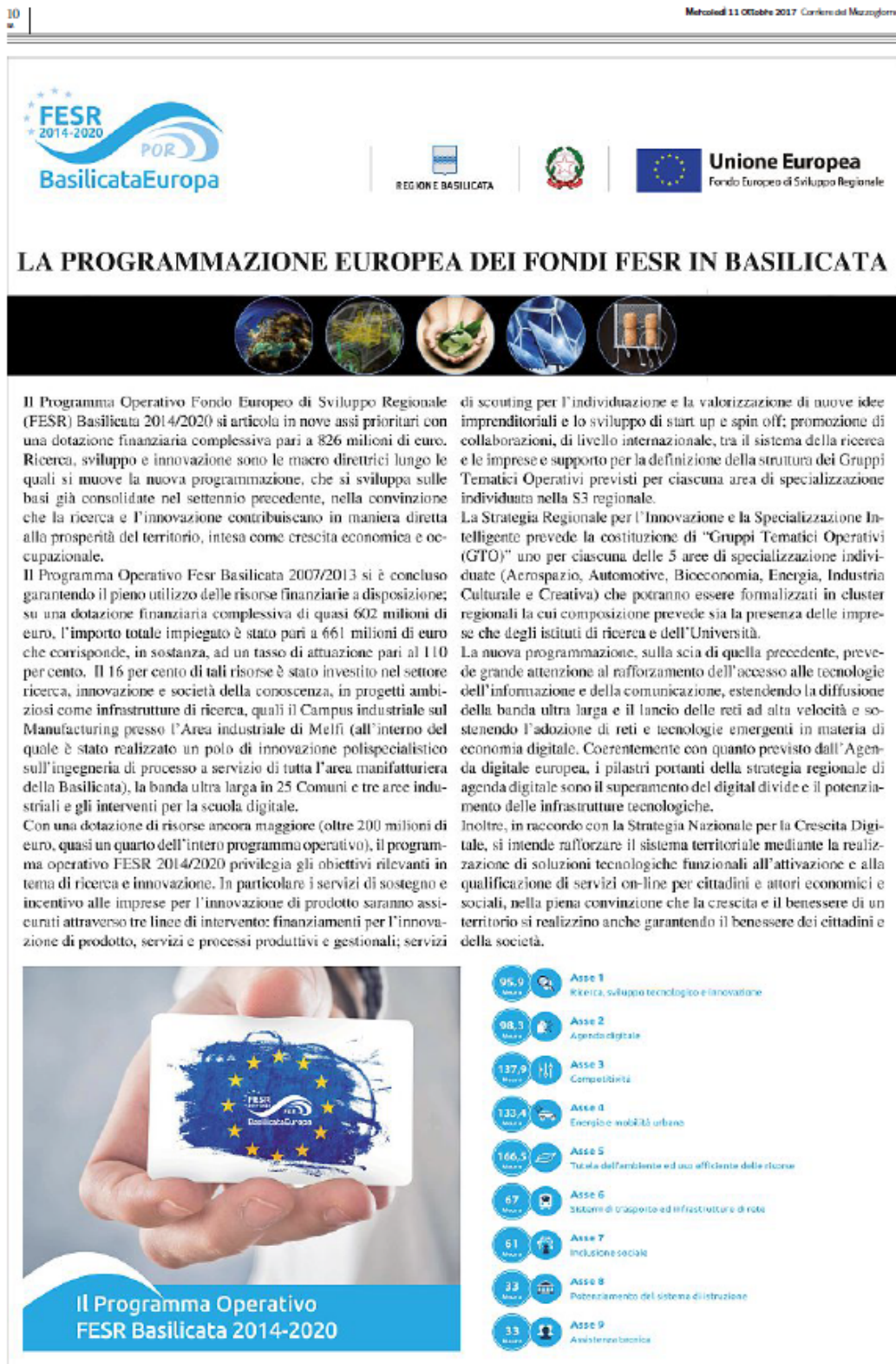
Figura 2 – Pagina illustrativa sul Corriere del Mezzogiorno