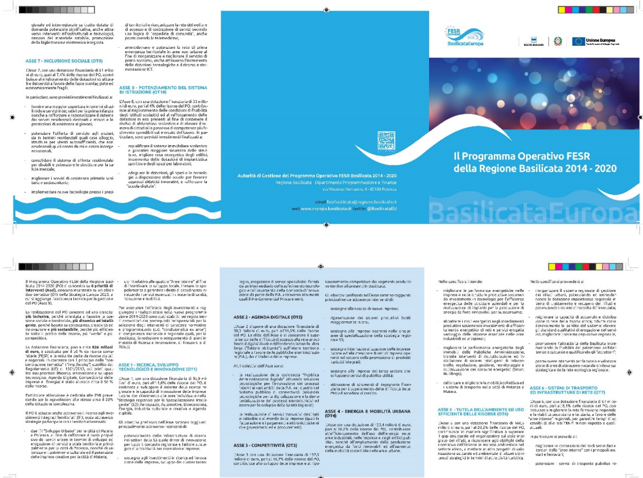
Figura 1 – Pieghevole illustrativo del PO FESR Basilicata 2014-2020 in pillole