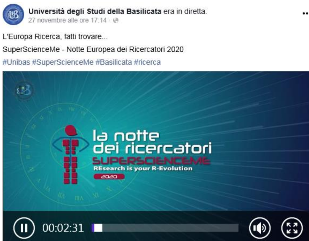
Figura 10 – Evento "La Notte dei ricercatori 2020"