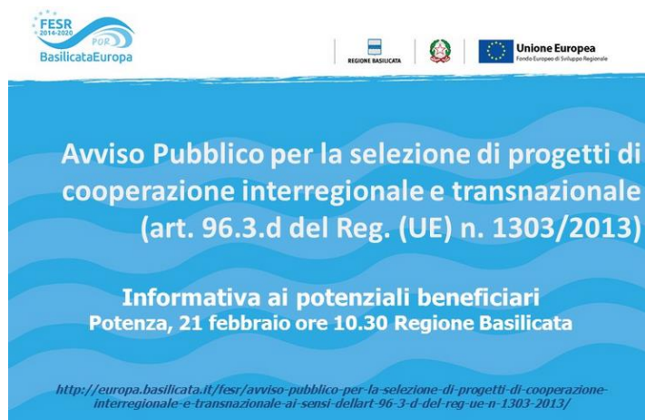
Figura 11 – Presentazione dell'Avviso per la selezione di progetti di cooperazione interregionale e transnazionale - Potenza, 21 febbraio 2020

La newsletter informativa conta 360 iscritti e mira a stimolare la conoscenza, la partecipazione e la rendicontazione sociale e narrativa degli interventi intrapresi e delle opportunità offerte dal Programma. Per quanto riguarda gli avvisi pubblici a favore di enti pubblici, oltre alla prassi consolidata di inviare comunicazione diretta a tutti i potenziali beneficiari della pubblicazione del bando, sono stati organizzati diversi seminari informativi e conferenze stampa. Si cita l'incontro tenuto il 21 febbraio 2020 c/o la sala B del Consiglio Regionale, a Potenza dall'Autorità di Gestione del PO FESR Basilicata 2014-2020 per informare i potenziali beneficiari su Avviso Pubblico per la selezione di progetti di cooperazione interregionale e transnazionale (ai sensi dell'art. 96.3.d del Reg. UE n. 1303/2013).