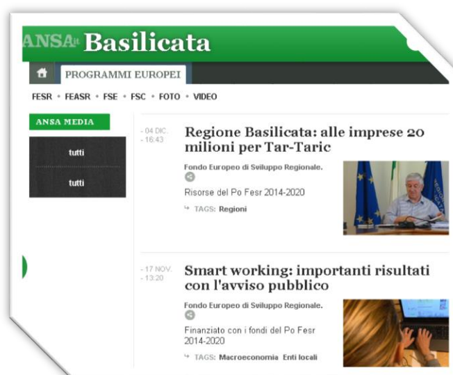
Figura 5 – Home page sito Ansa.it Basilicata – Sezione Fondi europei

Il progetto ha previsto inoltre la pubblicazione sul canale “ANSA Europa” e trasmissione al notiziario regionale Basilicata, la produzione e pubblicazione di notizie inerenti le attività dei fondi SIE e FSC 2014-2020, la condivisione di news su account social ANSA con menzione e tag account fondi SIE e la pubblicazione