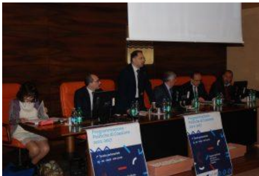
Figura 12 – Programmazione 2021-2020 - 1° Tavolo Partenariale - Potenza, 25 febbraio 2020

Al fine di poter comunicare al più ampio pubblico le attività è stato anche realizzato il sito http://europa.basilicata.it/2021-27/