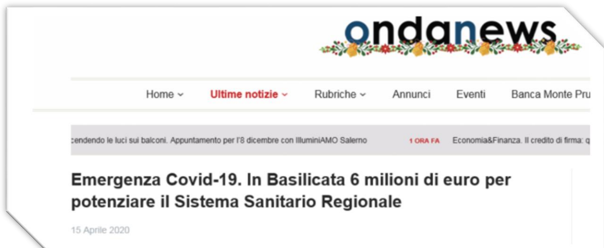
Figura 3 - Ondanews 15 aprile 2020

Obiettivo degli elaborati è stato quello di dare la più ampia informazione possibile circa le iniziative e le opportunità offerte al territorio, alle imprese, agli enti locali e ai cittadini grazie ai fondi comunitari Fesr anche in relazione alle opportunità offerte dal Programma per combattere l'emergenza da Covid-19.