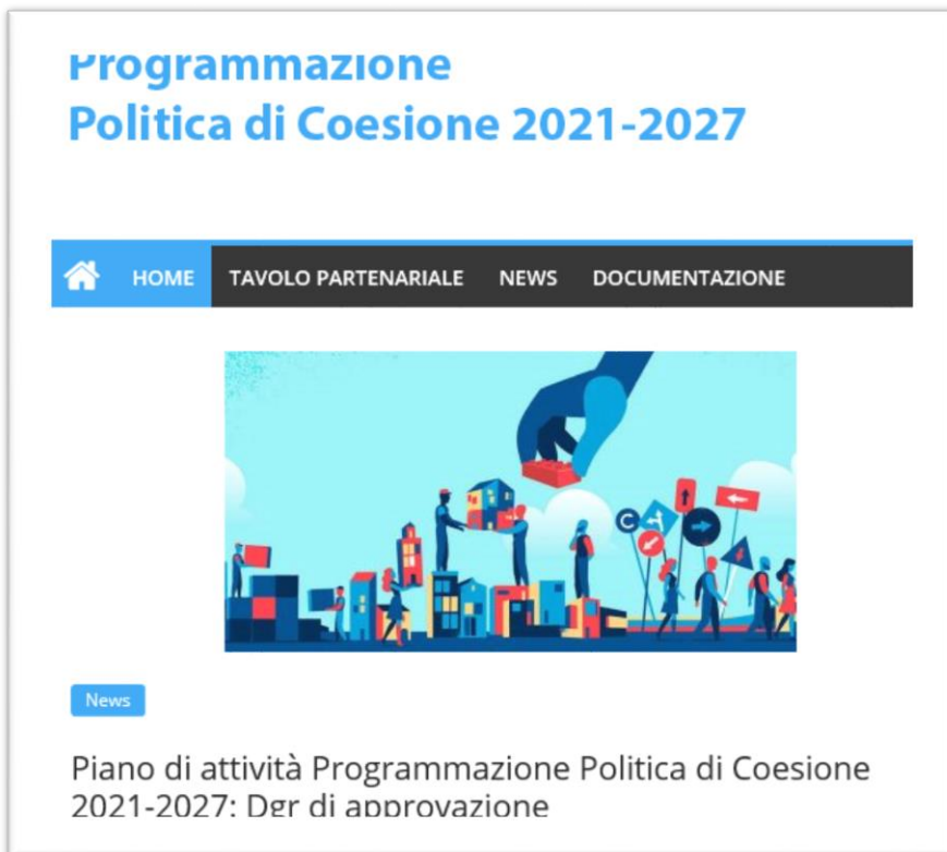
Figura 13 - Sito web “Programmazione Politica di Coesione 2021-2027”

Sono stati organizzati alcuni incontri sulle opportunità offerte dal PO FESR Basilicata 2014-2020; in particolare si segnala: