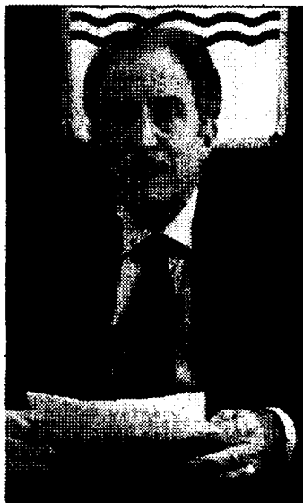
Il presidente Bardi

La sospensione si applica con riferimento ai termini di scadenza per l'avvio e la conclusione delle operazioni indicati negli avvisi o bandi di selezione, negli accordi di programma, e negli atti di ammissione a finanziamento; nonché ai termini richiesti dai beneficiari nelle riunioni o nei Comitati di indirizzo e coordinamento con l'autorità di gestione. La medesima deliberazione stabilisce anche che per i progetti rientranti nella tipologia di appalti