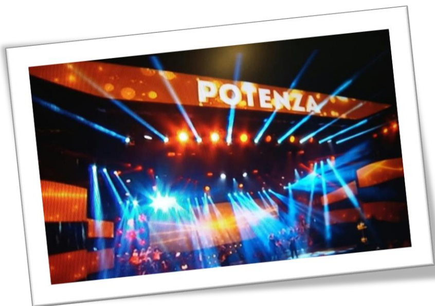
Figura 4 – Capodanno RAI, Potenza

In tale ambito il PO FESR ha finanziato il capodanno Rai “L’anno che verrà”, svoltosi a Potenza il 31.12.2019, la cui diretta trasmessa dalle 21 alle 2 di notte su Rai 1 ha conquistato 4.772.000 spettatori pari al 30.4% di share dalle 20.53 alle 24.56, e 2.840.000 spettatori (31.8%) dalle 24.59 alle 25.59. Durante la trasmissione TV è stato dato ampio spazio promozionale al Programma Operativo FESR tramite la proiezione diffusa del logo FESR.