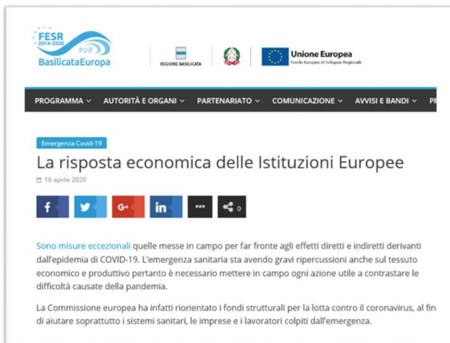
Figura 8 – Sito Basilicata Europa FESR – Sezione Emergenza Covid-19