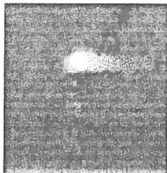
AVVISTAMENTO Nella notte tra il 24 e 25 marzo

LAGONEGRO. La notte tra il 24 e 25 marzo 2018, intorno alle ore 3.30, un oggetto volante non identificato con scia ha destato interesse, curiosità e preoccupazione nella popolazione italiana. Tra l'altro, agli occhi di molti è come dimostrato dai numerosi video e foto in circolazione, l'oggetto apparso piuttosto grande. Tante località italiane interessate, compreso Lagonegro e Maratea (si veda la Gazzetta del 26 marzo scorso) La circostanza ha destato sconcerto tra i residenti di tali zone, in quanto la stazione spaziale cinese Tiangong 1, in caduta libera proprio in questo periodo, potrebbe cadere, con possibilità a dire il vero molto remote, quasi impossibili da verificare, proprio sul centro sud Italia. Qualcuno ha pensato addirittura ad un'invasione aliena, suggestionato da tanti film in cui gli alieni arrivano in maniera spettacolare proprio come per il fenomeno osservato in queste notti. Tuttavia, Angelo Carannante, presidente e fondatore del Cufom, acronimo di Centro Ufologico Mediterraneo, ha dichiarato che la soluzione potrebbe essere un'altra rispetto a quelle considerate. Infatti l'«ufo», come potrebbe essere definito l'oggetto avvistato proprio in quanto non identificato, potrebbe essere un bolide cioè un frammento di cometa o asteroide ma con luminosità negativa (più luminoso). Possiamo considerare bolide l'oggetto che deve avere una magnitudine pari a quella massima di Venere