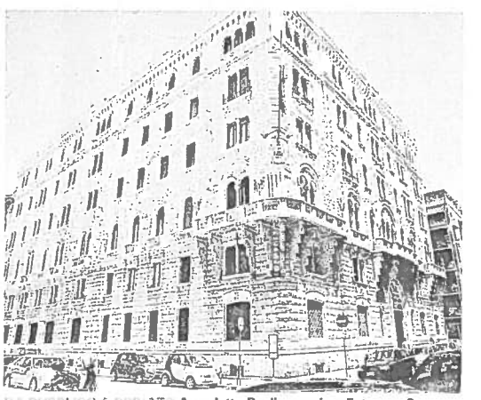
LA PUBBLICAZIONE DEL 27 Aquedotto Pugliese, prima Ente, ora Spa