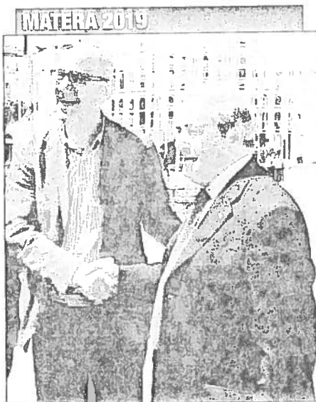
Adduce (a sinistra) con il sindaco di Matera

Adduce conquista la Fondazione Ma è già polemica