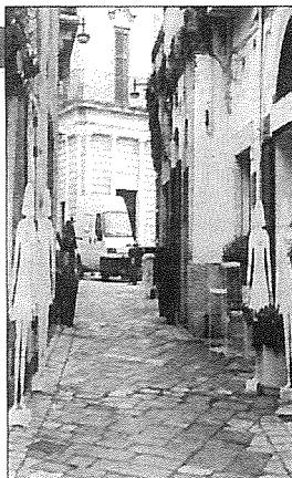
Sagome di donne per strada a Marconia