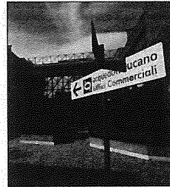
La sede di Acquedotto lucano