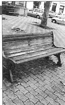
La panchina rossa sparita a Lagonegro