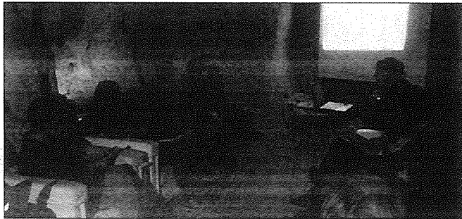
L'incontro a Matera in Casa Cava con il delegato della commissione europea Detlef Eckert

Dal canto suo Eckert ha spiegato il senso di una presenza costante che l'Europa intende garantire al fianco di Matera.