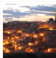
L'Open Design School di Matera: