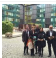
Primo incontro di monitoraggio della