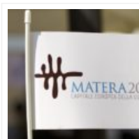
10 studenti materani rappresenteranno