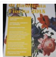
Festa di Basilicata Fiorita 2015: ogni